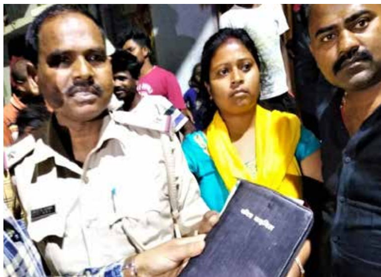
Dorfbewohner händigen Polizisten Bibeln als Beweismaterial gegen Christen aus.