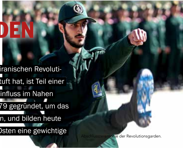
Abschlusszeremonie der Revolutionsgarden.

Dass die Regierung von US-Präsident Donald Trump die iranischen Revolutionsgarden als „ausländische Terrororganisation“ eingestuft hat, ist Teil einer breit gefächerten Strategie, um Teherans wachsenden Einfluss im Nahen Osten einzudämmen. Die Revolutionsgarden wurden 1979 gegründet, um das islamische Regime vor inneren Bedrohungen zu schützen, und bilden heute eine Elitetruppe, die im Iran sowie im gesamten Nahen Osten eine gewichtige militärische, wirtschaftliche und politische Rolle spielt.